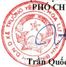
Trần Quốc Trường